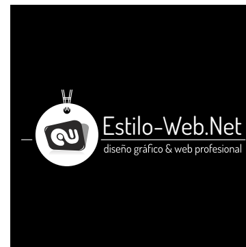
BLANCO SOBRE NEGRO