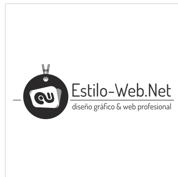
NEGRO SOBRE BLANCO